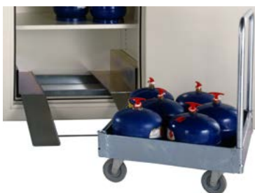
Vagn inkl. ramp