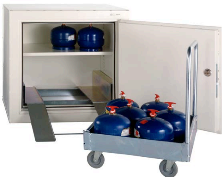
EI30-GAS2 med vagn och hylla